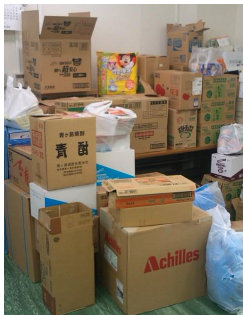
水戸地本へ無事に届けました!

ガソリンスタンドは閉鎖店が多く（売り切れ、ロープで入場規制）スーパーにおいては電池は売り切れ、水は1人3本・カップ麺は1人3個・餅は3袋までと購入制限されていました。