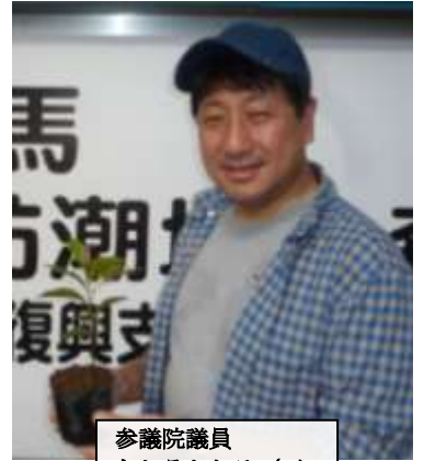
参議院議員 たしろかおる さん