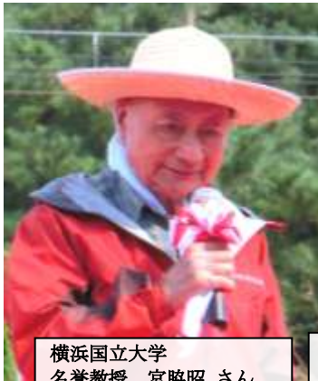
横浜国立大学 名誉教授 宮脇昭 さん